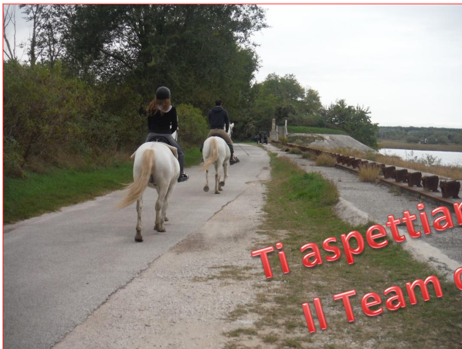
Isola della Cona.